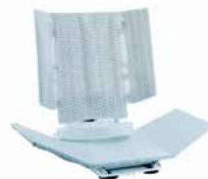
Beschikbaar met zijsteunen voor rug. / Disponible avec des maintiens latéraux de dossier. Code 1573970 - Wit / Blanc Code 1573974 - Blauw / Bleu