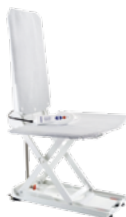
Aquatec Orca XL Max.gebruikersgewicht:170kg - Wit. Poids maxi utilisateur : 170 kg - Blanc. Code 1573685